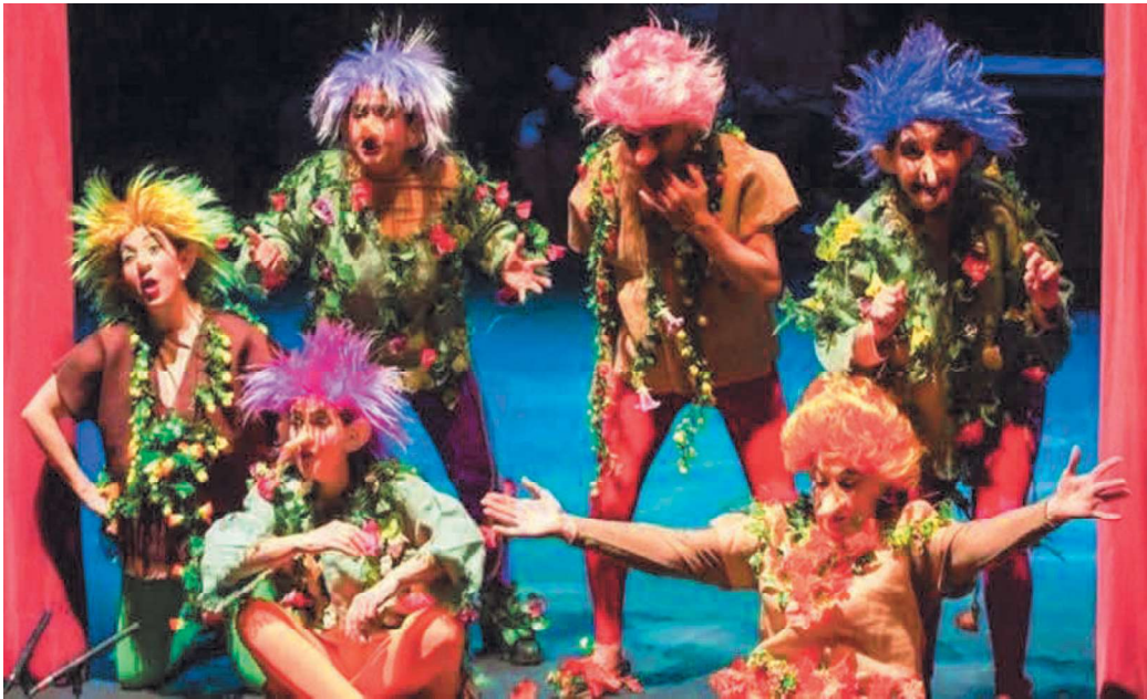
Los Duendes y Perlimplin”. Claurura del Festeaf 2018”

“PORQUE AMAS EL TEATRO, PUEDES VIVIR MIL VIDAS CON UN SOLO CORAZÓN” (Unicornio Teatro)